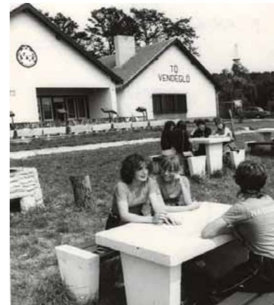
1983. június 25. A mai Korona Szálló elődje