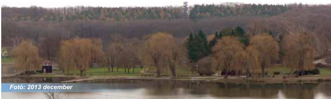
Fotó: 2013 december