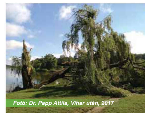
Vihar után, 2017