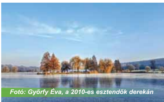
Fotó: Györfy Éva, a 2010-es esztendők derekán