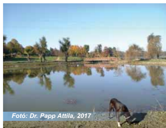
Fotó: Dr. Papp Attila, 2017