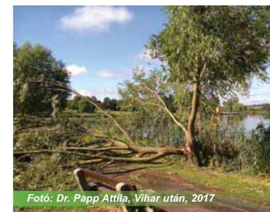
Vihar után, 2017