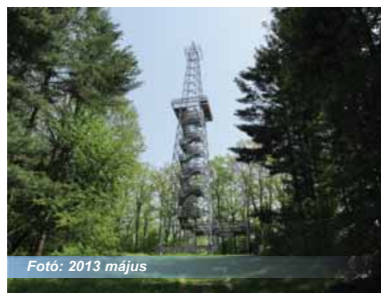
Fotó: 2013 május