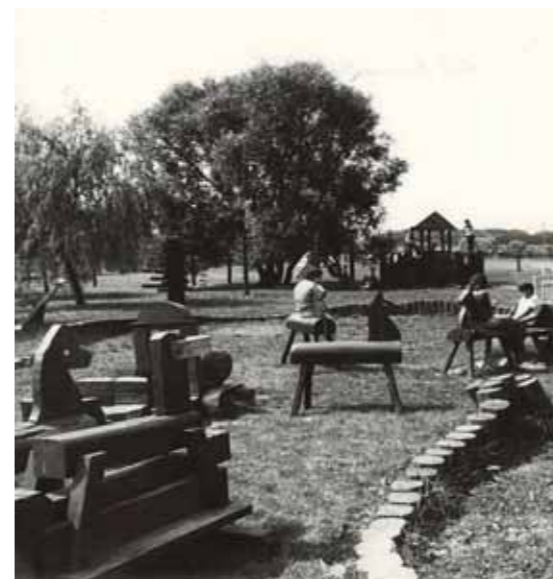
1983. június 25. A játszótér a Hétkükkfa-forrás mellett

naki és a látóhegyi patak táplálja majd. Egyébként a cél érdekében a bakónaki patak rendezése, a vízvezető csatoma építése is megtörtént.