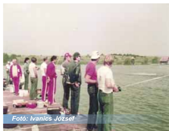
Fotó: Ivanics József