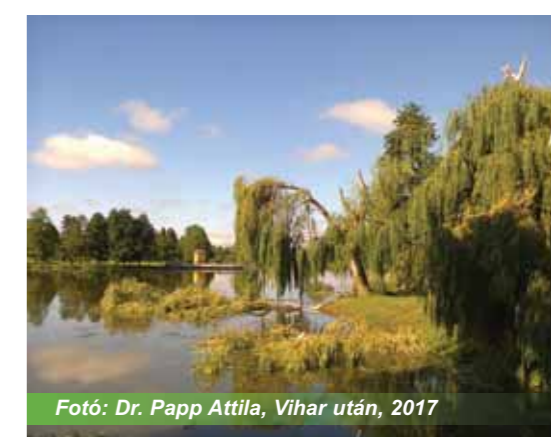
Fotó: Dr. Papp Attila, Vihar után, 2017