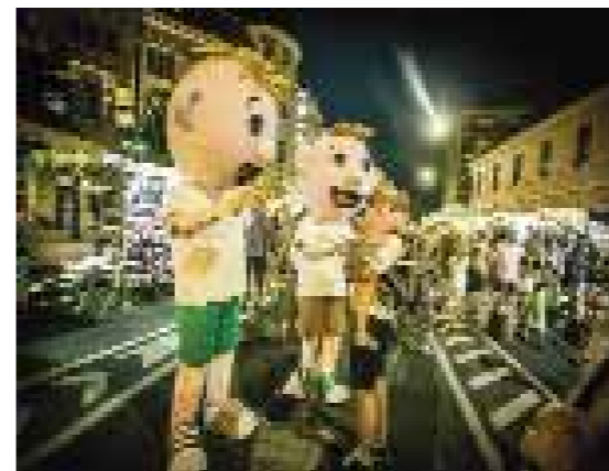
ÉLIÁS, TÓBIÁS, EGY TÁL DÖDÖLLE...

mészeti és kulturális értékeket. És a Csónakázó-tó is lehetőséghez jutott, mivel egy kerékpáros látogatóközpont és egy nemzetközi futamok megrendezésére jogosuló XCO versenypálya is elkészült itt.