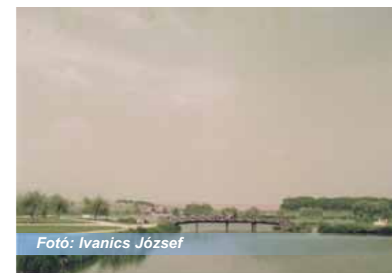
Fotó: Ivanics József