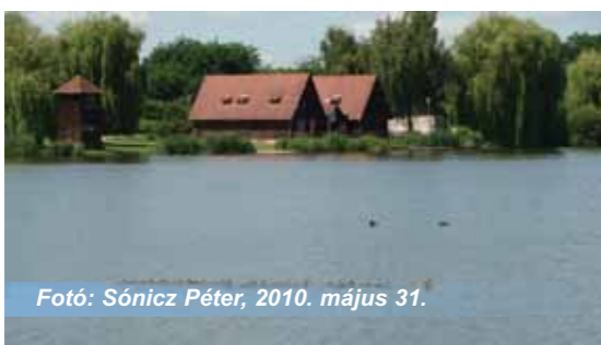
Fotó: Sónicz Péter, 2010. május 31.