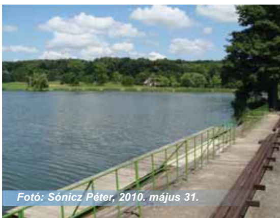
2010. május 31.