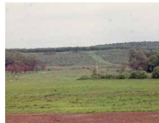
Közelebbi fotó a leendő tó helyén lévő legelőről, illetve a majdani torony alatt lévő szánkódombról.

Háttérben a „szánkódomb”, még a kilátótorony nélkül, és amint látható, mindkét oldalán fiatal, szinte csemete-egyedekből álló fenyves övezi. Mára ebben a fenyvesben található a kerékpárosok ügyességi pályája, a fenyőcsemetékéből pedig hatalmas fák cseperedtek. A fotó előterében a leendő tó területén még egy birkanyáj legelészik, és jól látható a vasútvonal is. Amint az megfigyelhető, Földes Kálmán a fotót nagyjából onnan állva készíthette, ahol most a 61-es elkerülő út felüljárója elhalad a kajakosok csónakházához vezető sétány felett.