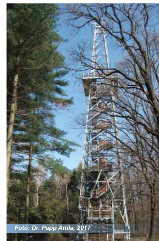
Fotó: Dr. Papp Attila, 2017