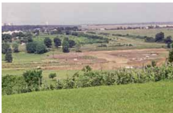
Táj a város felé, előtérben a zsilipház, árapasztó és a gátépítő munkagépek

Amint az látható, ekkoriban már megépült az új víztorony monumentális, fehér színű „hengere”, illetve állt a Platán sori, ún. „piros” tízemeletes, valamint a Bartók Béla utca három toronyháza is. A keleti városrészt, illetve annak tízemeletes panelháza csak az elkövetkezendő évtizedben épültek fel.