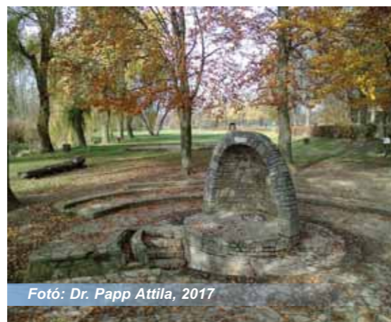
Fotó: Dr. Papp Attila, 2017