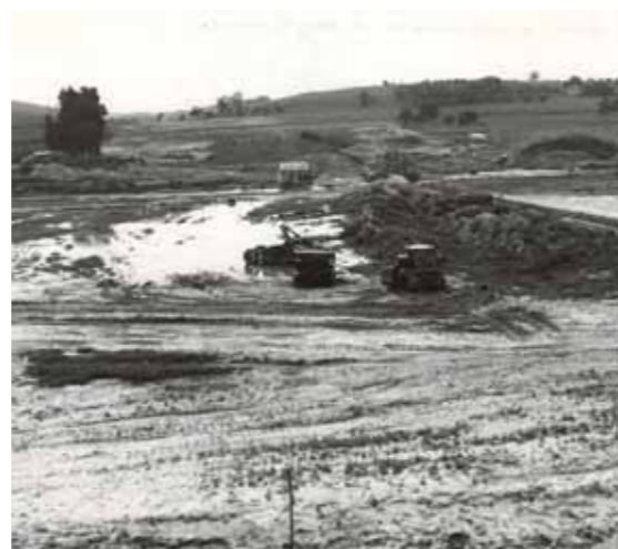
Fotó: ZH Archív, 1973. augusztus 3.

A kaposvári úttól északra a vasúti töltés mentén lényegében a bakónaki patak völgyében serény munka képe bontakozik ki. Egy kotrógép marja a földet, s három lánctalpas földnyeső dolgozik még a helyszínen.