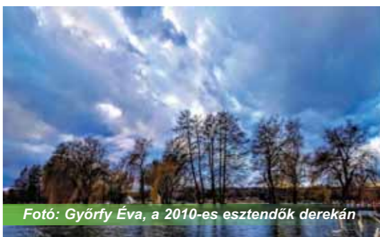
a 2010-es esztendők derekán