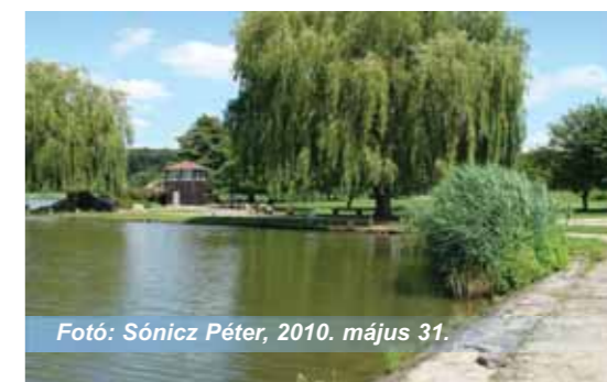
Fotó: Sónicz Péter, 2010. május 31.