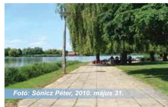
2010. május 31.