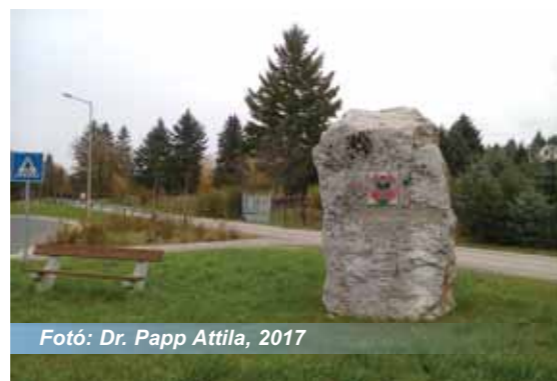
Fotó: Dr. Papp Attila, 2017