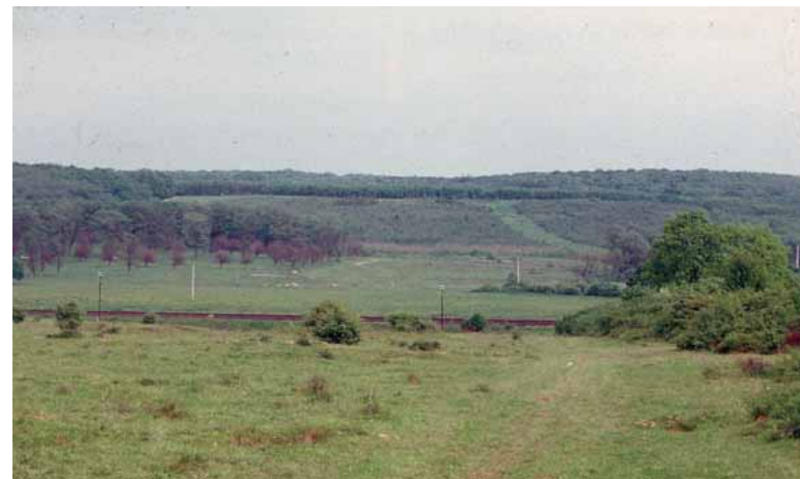
Távlati kép a leendő Csónakázó-tóról a sánci dombtetőről készítve, még az építkezés megkezdése előtt.