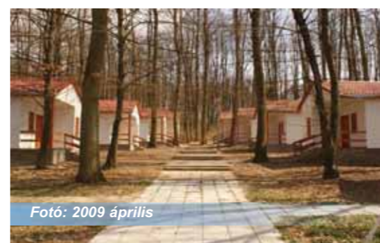
Fotó: 2009 április