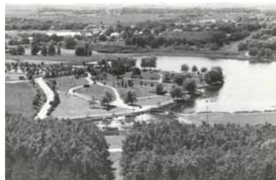
1993. október 12.

Kísérőink egyébként örömmel újságolták, hogy az első fecskék már meg is jelentek a helyszínen. A kanizsai vasutasok például már két szombatukat áldozták a leendő parkerdőre, a DÉDÁSZ légvezetékek áthelyezésénél 90 ezer forint értékű társadalmi munkát ajánlott fel, de a jelentkezők listáján van a