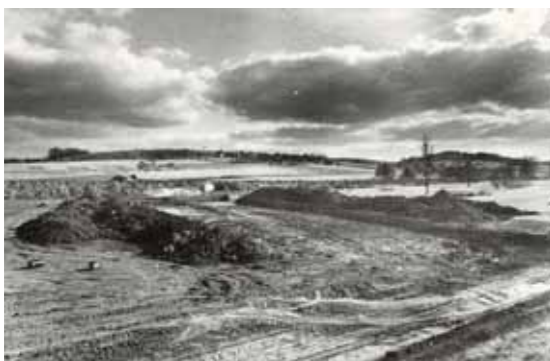
1972. október 25.

2017. augusztus 03. szerző: Zalai Hírlap