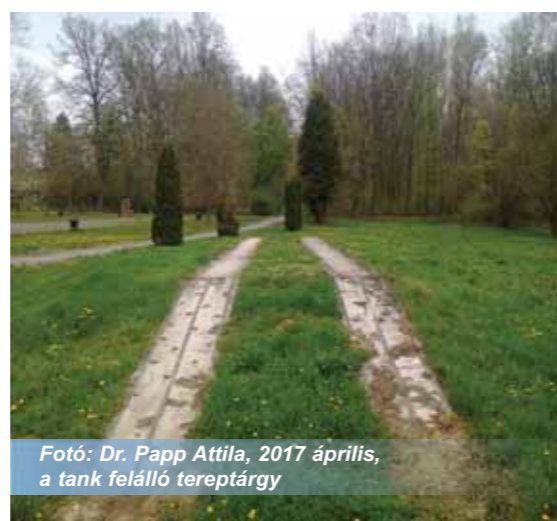
2017 április, a tank felálló tereptárgy