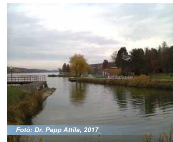
Fotó: Dr. Papp Attila, 2017