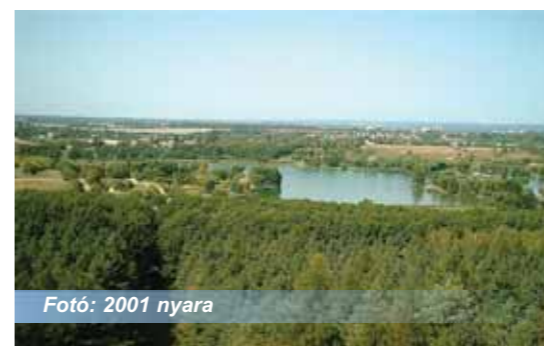
Fotó: 2001 nyara

Ebben a fejezetben néhány érdekesebb cikket közlök a közelmúltból, egy évtized távlatából. Az újságcikkeket Nagykanizsa hivatalos újságja, a Kanizsa Hetilap hasábjairól válogattam. Amint az megfigyelhető, az 1990-es évek végén, illetve a 2000-es években folyamatosan romlott és erodálódott a Csónakázó-tó környezete: a tavat érintő pozitív változásokról először a 2010-es évek elején lehetett beszámolni, Cseresnyés Péter polgármestersége (2010-2014) idején, majd a tó újrafelfedezése Cseresnyés Péter (mára a dél-zalai térség országgyűlési képviselője, államtitkár, a Mura-program miniszteri biztosa) munkáján kívül a 2014 októberétől regnáló új városvezető, Dénes Sándor nevéhez köthető.