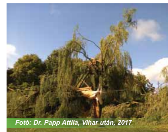
Vihar után, 2017