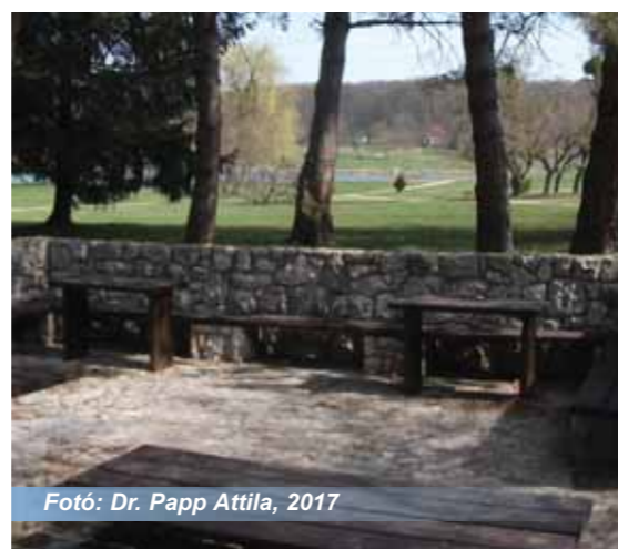
Fotó: Dr. Papp Attila, 2017