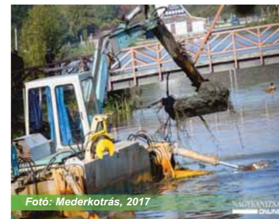
Fotó: Mederkotrás, 2017