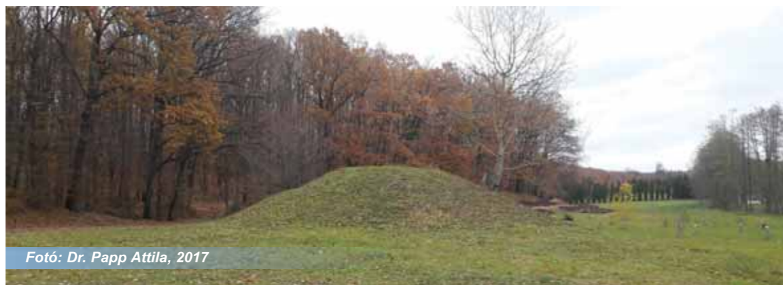
Fotó: Dr. Papp Attila, 2017