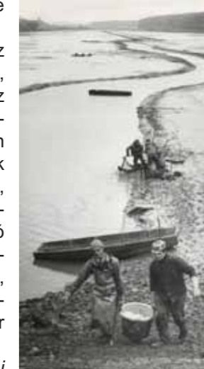
1987. november 18. A tó lecsapolása