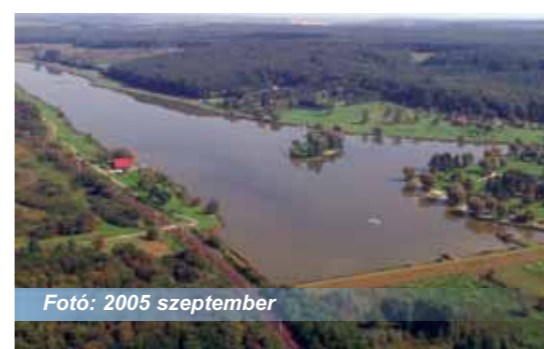
Fotó: 2005 szeptember