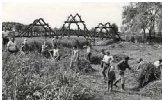
1988. július 18. Folyik a tó kitisztítása

Így mindenképp a földszállításban várának segítséget, a kilátótoronyhoz vezető sétautak kialakításához várják a társadalmi munkásokat, de másutt is lenne most már tennivaló bőven.