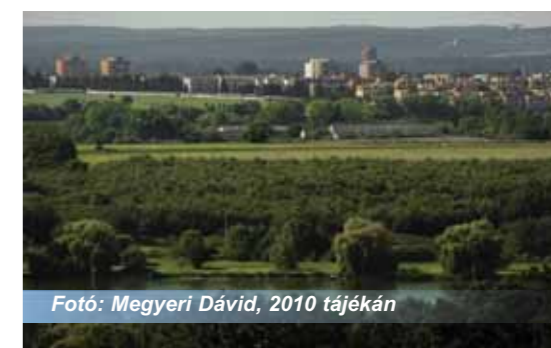
Fotó: Megyeri Dávid, 2010 tájékán