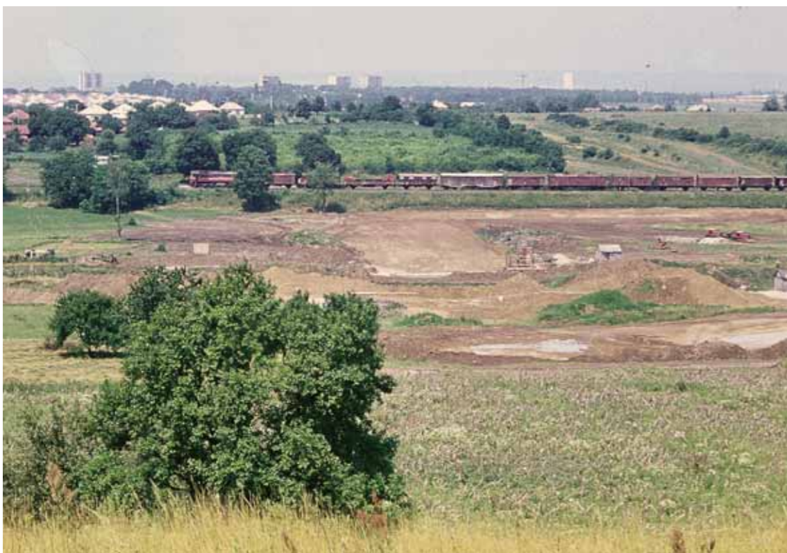
A tó gátrészének építómunkálatai, a háttérben Nagykanizsa.

Amint az látható, ekkoriban már megépült az új víztorony monumentális, fehér színű „hengere”, illetve állt a Platán sori, ún. „piros” tízemeletes, valamint a Bartók Béla utca három toronyháza is. A keleti városrészt, illetve annak tízemeletes panelháza csak az elkövetkezendő évtizedben épültek fel.