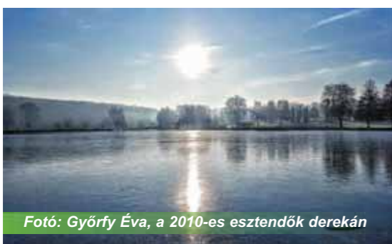
Fotó: Györfy Éva, a 2010-es esztendők derekán