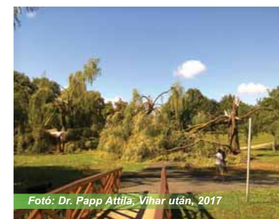
Fotó: Dr. Papp Attila, Vihar után, 2017