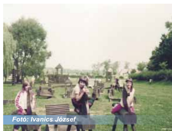
Fotó: Ivanics József