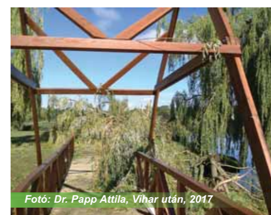
Fotó: Dr. Papp Attila, Vihar után, 2017