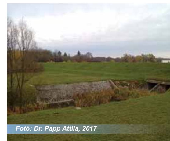
Fotó: Dr. Papp Attila, 2017