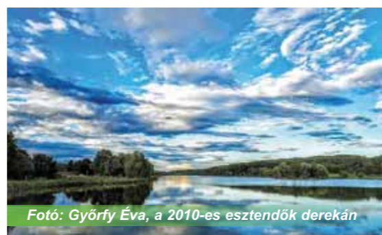
a 2010-es esztendők derekán