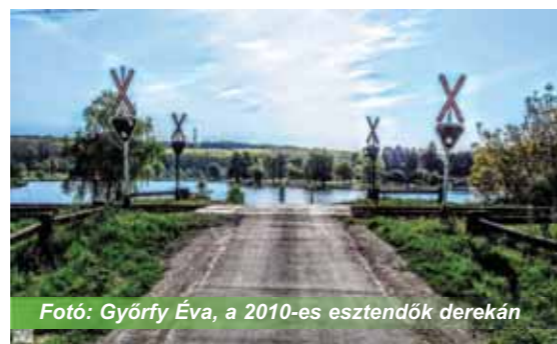
Fotó: Györfy Éva, a 2010-es esztendők derekán