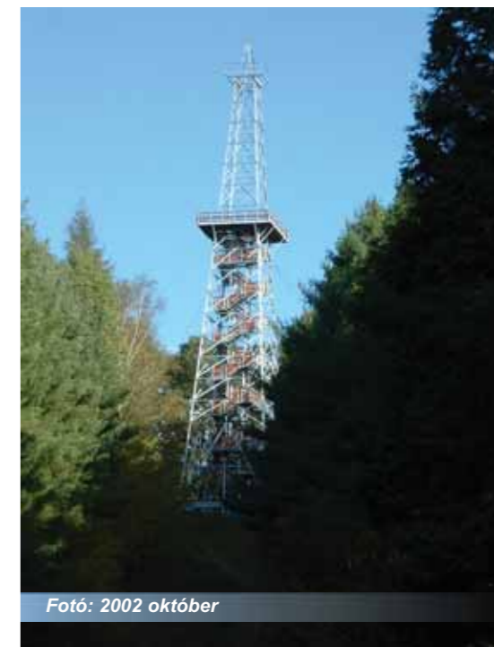
Fotó: 2002 október