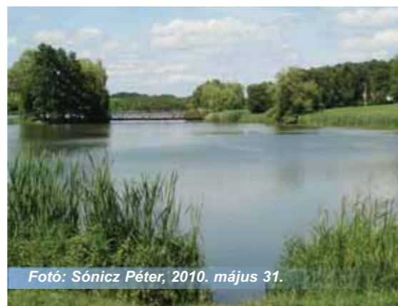
2010. május 31.